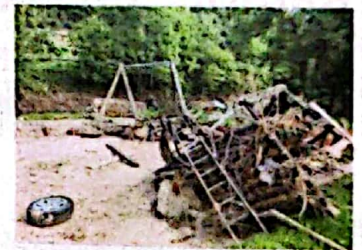
• Das Spendenziel lautet: Beschaffung einer neuen Matschanlage für die flutgeschädigte KiTa in Kreuzweingarten.

www.bundespolizeibiker.de , www.facebook.com/groups/Bundespolizeibiker ; Twitter: @Bpol-Biker.